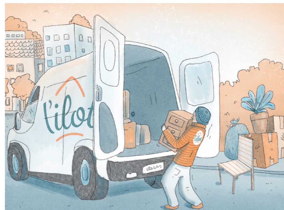
De SIL begeleidt daklozen wanneer ze in een woning intrekken en biedt hun meubels, elektrische apparaten en decoratieve elementen aan.

Hulp tijdens de verhuis of het intrekken in een woning, materiaal en meubels ter beschikking stellen, meubels installeren, schoonmaken en herstellingen en kleine werken uitvoeren zijn allemaal concrete acties aangeboden door de SIL, onze Huisvestingsdienst, die een sectorspecifieke aanpak heeft voor elke dakloze die gebruikmaakt van de Brusselse diensten. De SIL werd midden in de coronacrisis opgericht en is actief sinds november 2020. De dienst biedt logistieke begeleiding aan daklozen wanneer ze in een woning intrekken. De dienst helpt hen zich hun nieuwe woonplek eigen te maken zodat ze zich er daadwerkelijk thuis voelen. Doordat wij hen meubels, elektrische apparaten, decoratieve elementen, enz. laten kiezen en gratis geven, kunnen begeleide personen hun nieuwe interieur naar eigen smaak inrichten. Zo voelen zij zich waardiger en wordt de band met hun woning versterkt, wat de kans om de woning te behouden vergroot.