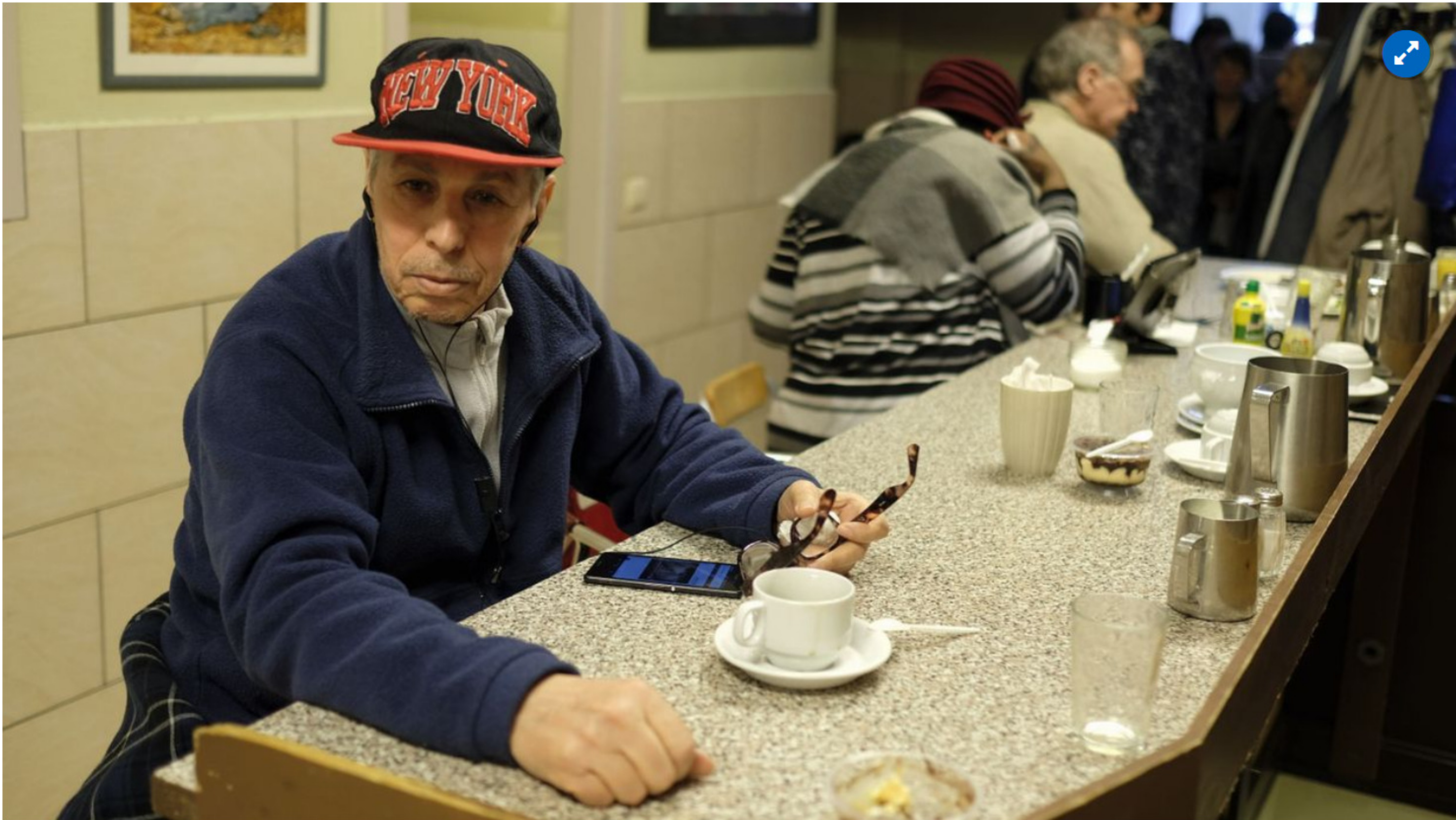
Coronavirus: L'ilot maintient son accueil quotidien pour 150 sans-abri