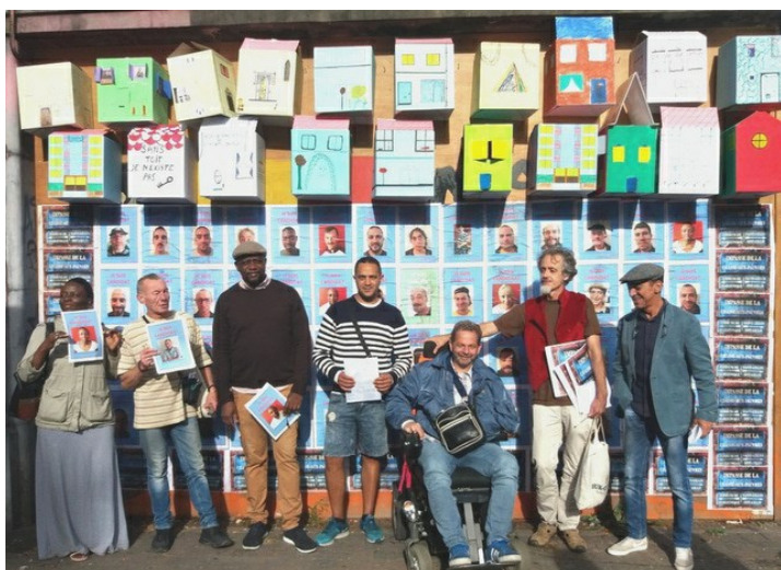
© Lisa Pleysier / BRUZZ | Dakloze actievoerders vragen een woning en meer aandacht voor hun situatie vanuit het beleid

SAMENLEVING BRUSSEL-STAD GISTEREN 16U14 LP © BRUZZ